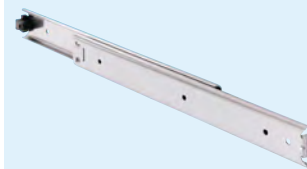
Stainless steel Acier inoxydable Edelstahl